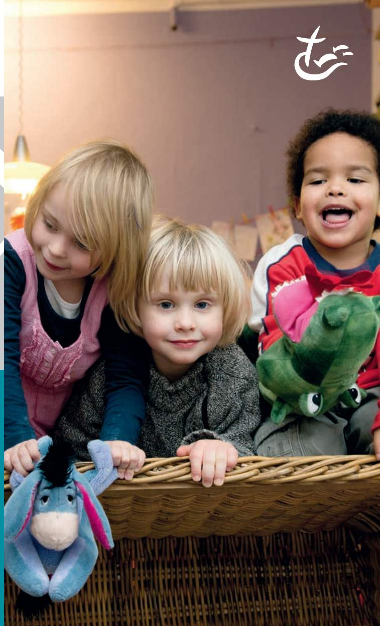
dialogo®, 10.2021 - dialogo.de | Fotos: Elisabeth Schöppe